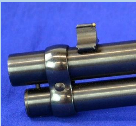
Runder-Lauf mit eingefrästem Schwalbenschwanz

Korn mit Befestigungsschrauben Breite 15mm